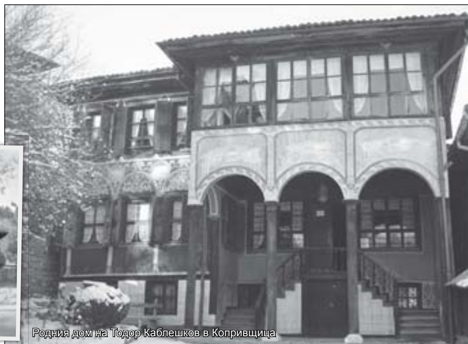
Родния дом на Тодор Каблешков в Копривщица