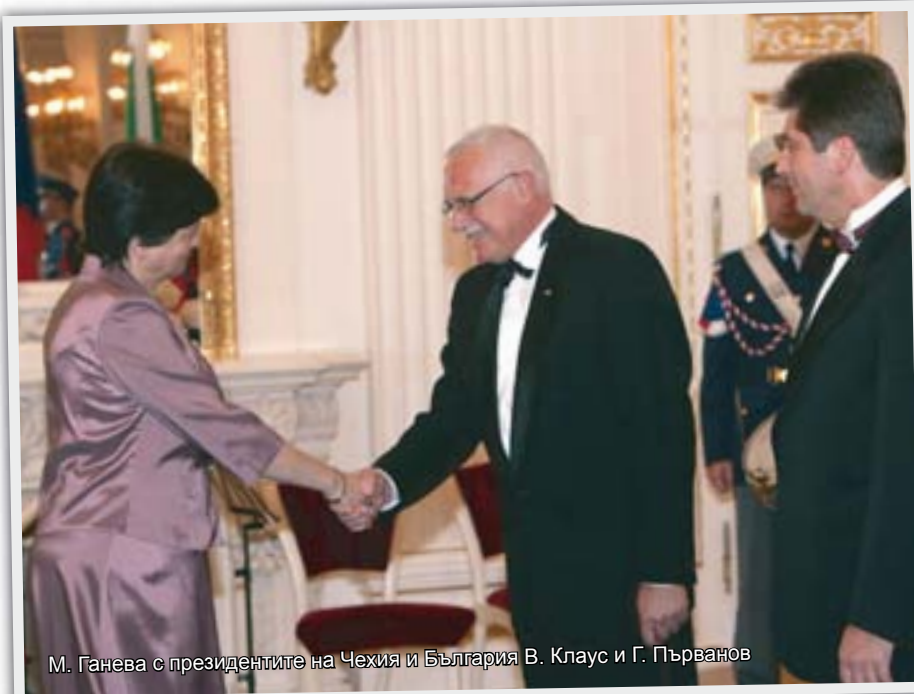
М. Ганева с президентите на Чехия и България В. Клаус и Г. Първанов

Мисля, че гледат на нас положително. А и традициите и данните в областта на туризма от последните години сочат, че чехите обичат да ходят на почивка в България. Няма човек, който да не обича мястото, където иска да прекара най-хубавите моменти от годината, т.е. ваканцията си. Факт е, че през последните години неколкратно отново нарасна туристопотокът на чешките граждани към България.