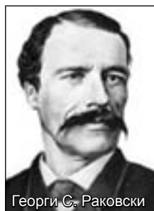
Георги Г. Раковски