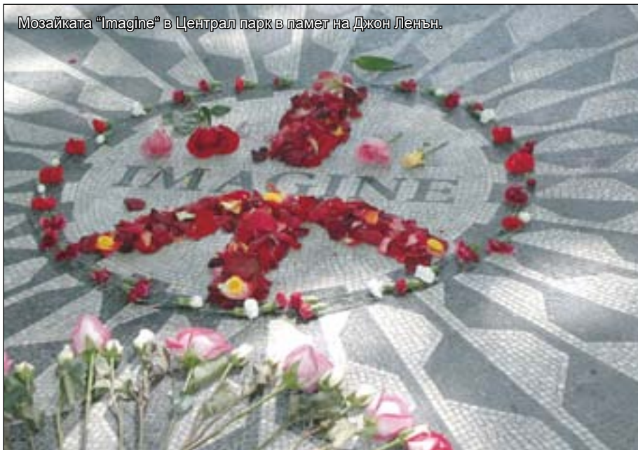
Мозайката "Imagine" в Централ парк в памет на Джон Ленън.

людница и навалица от хора, коли, огромни реклами, светещи неоновы светлини и всякакви екземпляри, които се опитват по всякакъв начин да получат някой долар от минувачите. Една от атракциите през последните години на Таймс Скуеър е свирещият на китара гол каубой. Със сомбреро, по слипове и с каубойски ботуши той пее кълтри и на вас не ви остава нищо друго освен да си кажете – всеки луд с номера си.