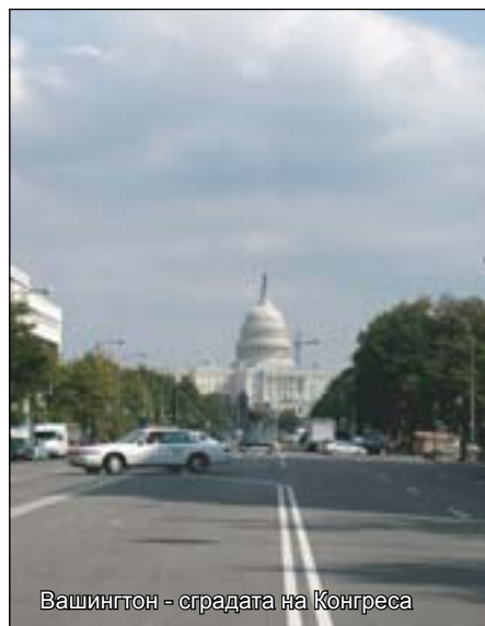
Вашингтон - сградата на Конгреса

се движите между огромни и добре поддържани тревни площи и паркове и имате възможността непосредствено да почувствате приповдигнатото и с патриотизъм изпълнено настроение на американците. Повечето от тях тук също са туристи. Пристигат във Вашингтон от всички краища на страната и са от всички възрастови групи. Най-много са учениците с училищните автобуси, дошли да се запознаят с най-значимите моменти и личности от американската история. Освен мемориалите и комплексите, посветени на най-известните американски президенти като Линкълн, Труман, Вашингтон или Айзенхауер, в задължителната програма на училищния излет влизат и Библиотеката на Конгреса или стените със имената на падналите във войните в Корея и Виетнам войници. Отправлям се към военното гробище Арлингтън, на което са погребват офицери