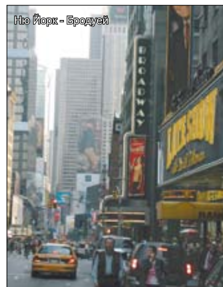
Ню Йорк - Бродуей