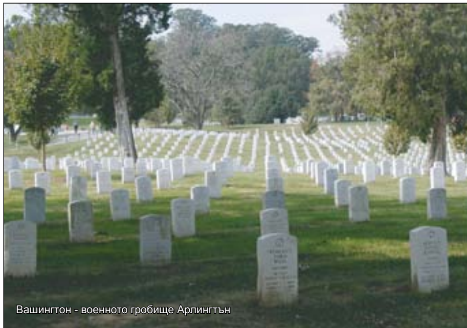
Вашингтон - военното гробище Арлингтън

и заслужили личности като екипажа на соваката Челинджър или президента Джон Кенеди и неговата съпруга Жаклин. И тук цари приповдигната атмосфера като в останалите части на столицата, която на практика е един огромен музей под открито небе.