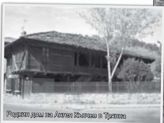
Родния дом на Ангел Кънчев в Тръвна