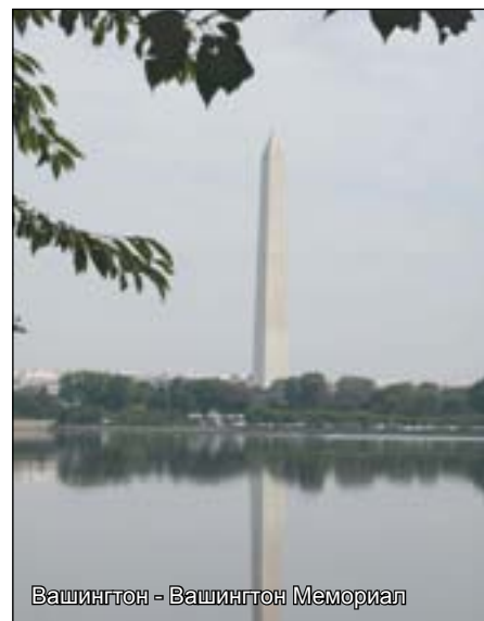
Вашингтон - Вашингтон Мемориал