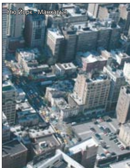
Ню Йорк - Манхатън

Към която и да е област на изкуството, историята, спорта, модата и т.н. да са насочени вашите интереси, можете да сте сигурни, че в Ню Йорк ще намерите най-доброто от това, което ви интересува. Аме-