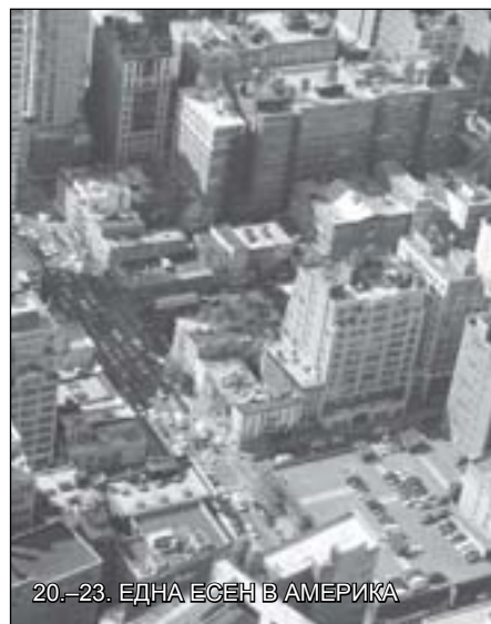
20.–23. ЕДНА ЕСЕН В АМЕРИКА