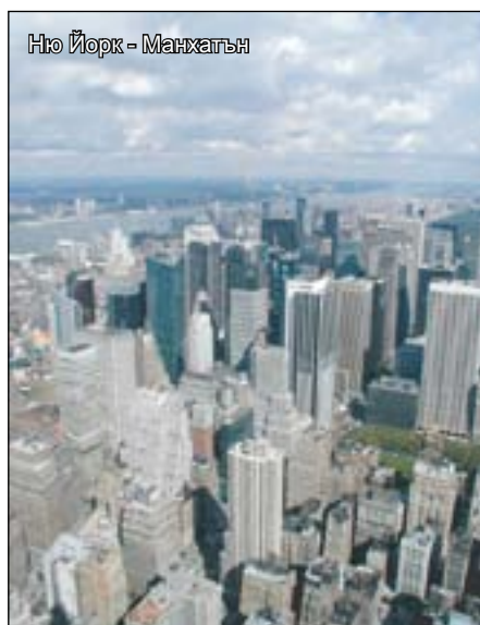
Ню Йорк - Манхатън