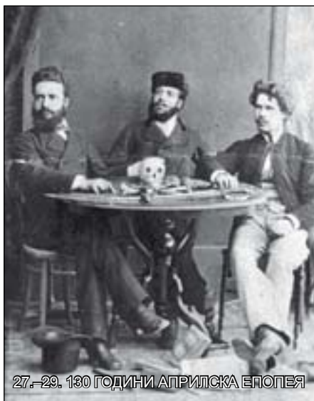
27.–29. 130 ГОДИНИ АПРИЛСКА ЕПОПЕЯ