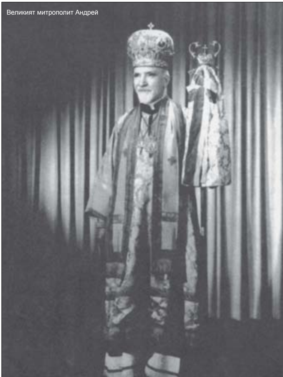
Великият митрополит Андрей