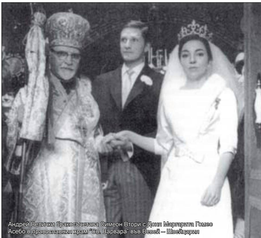
Андрей Велички бракосъчетава Симеон Втори с Доя Маргарита Гомес Асебо в православния храм “Св. Варвара” във Вевей – Швейцария

Когато всички връзки между двата воюващи блока през Втората световна война са прекъснати както по дипломатически път, така и по линията на Червения кръст и Червения полумесец, църквата работи активно за помиряване на света чрез митрополит Андрей. Той влиза в контакт с най-известни личности от световен мащаб. Рузвелт, Хемингуей, Айнщайн – това е малка част от световния елит, с който работи митро-