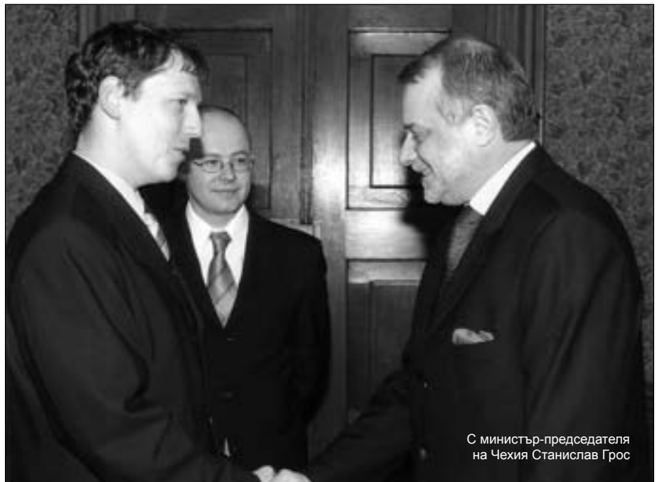
С министър-председателя на Чехия Станислав Грос

Веднага искам да кажа, че има и български инвестиции в Чехия. В Моравия има една т. нар. българска фабрика, има доста фирми със смесен капитал - най-вече