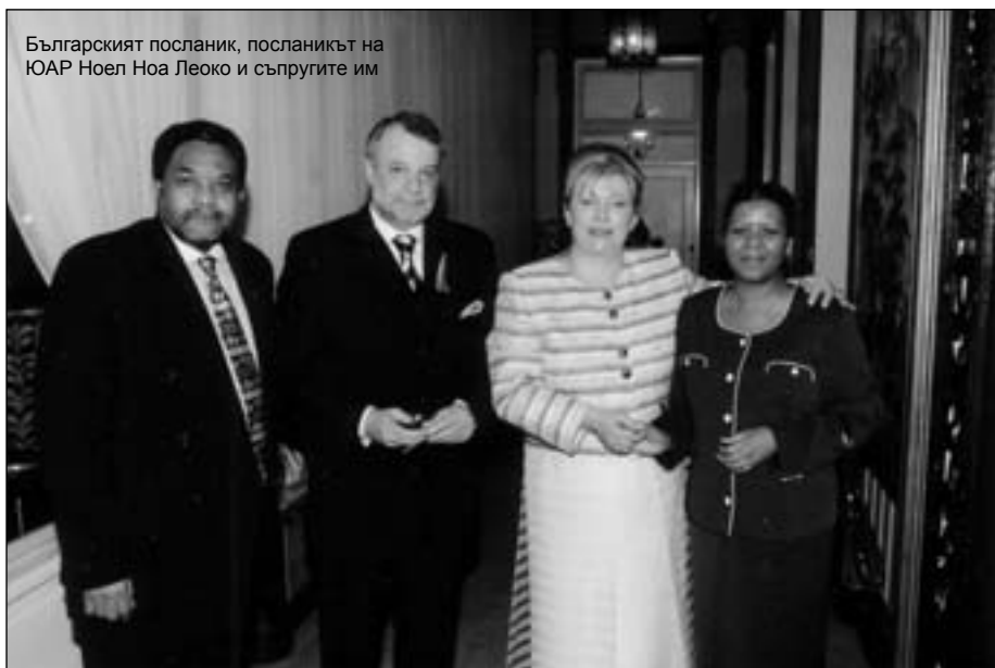
Българският посланик, посланикът на ЮАР Ноел Ноа Леоко и съпругите им

МАРТИН ТОМОВ е роден през 1950 г. в София. Следвал е в Чехия и в България - в Чешката политехника (ČVUT) в Прага и във Висшия икономически институт в София. В периода 1996 – 1999 г. е търговско – икономически съветник към Българското посолство в Прага. От 2000 г. е извънреден и пълномощен посланик на Република България в Чешката република. Женен е. Има една дъщеря.